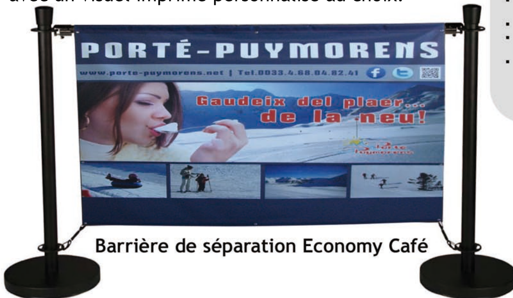
Barrière de séparation Economy Café

L'Economy Café est une barrière de séparation pour délimiter des zones (restaurants, terrasses de cafés, entrée de salon professionnel, séparation de salle...) avec un visuel imprimé personnalisé au choix.